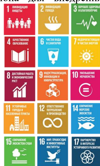
Рис. 4 – Вклад акселератора 3 в достижение ЦУР

Реализация мероприятий регионального акселератора «Территориально-ориентированное развитие и межсекторная кооперация» внесут вклад в достижение ЦУР (рис. 4).