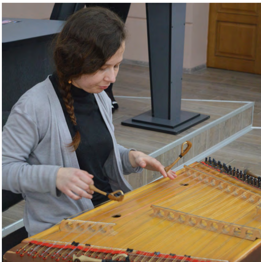
Лауреат международных конкурсов