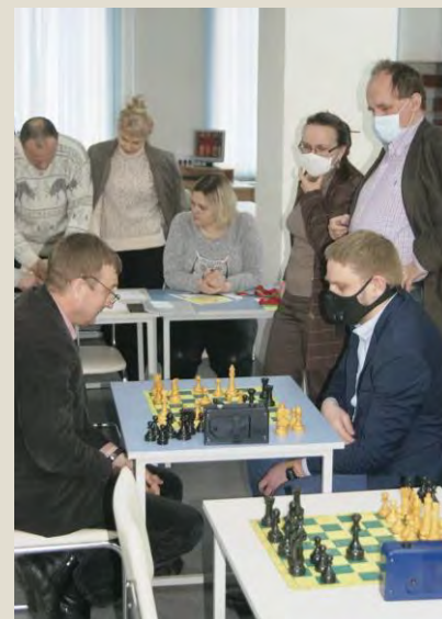
Факультет физического воспитания