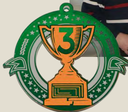
Факультет математики и естествознания