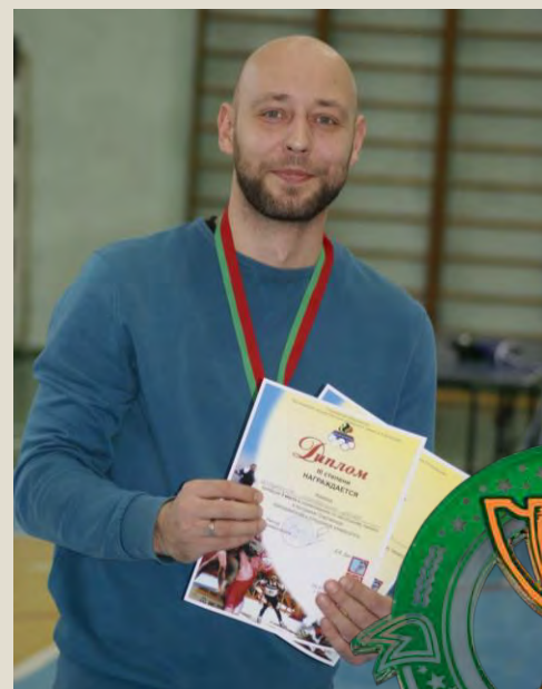
Факультет иностраннх языков